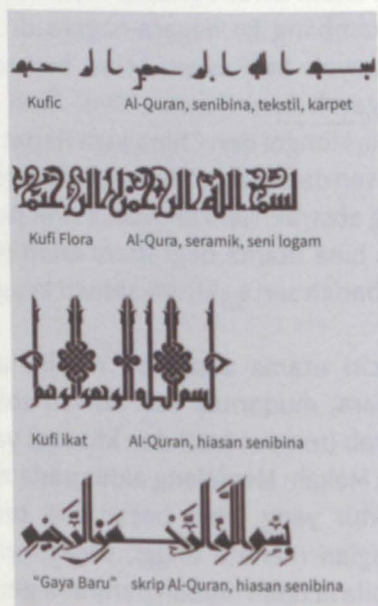
Rajah 4.2: Skrip kepelbagaian khat Kufi, pembacaan Bismillah.